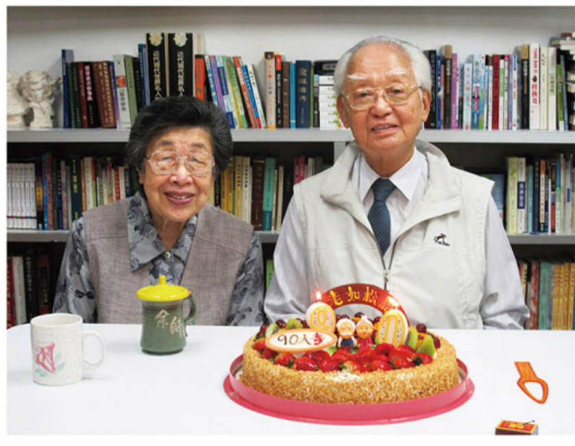
九十大壽與余師母合照於海天書樓，笑容可掬。