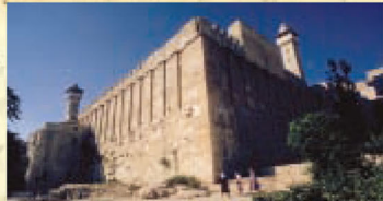
圖示族長墳墓，大希律將之建在傳統認為是亞伯拉罕、以撒和雅各埋葬的地點。

到了迦南，亞伯蘭最終“來到希伯崙便利的橡樹那裏居住”（創13:18）。希伯崙位於猶太山區的頂部，約在海拔3,350英尺（1,020米），甚具戰略性。